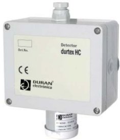
DURTEX HC DURTEX HC PRO

Módulo de relé de alarma programable opcional (4-20mA).