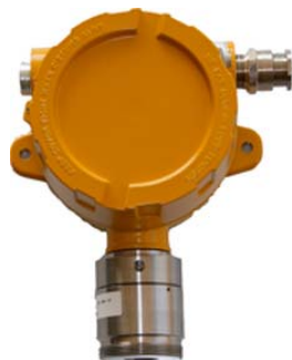
Envoltente antideflagrante LOM08ATEX2059X

En el caso de los detectores 4-20mA es imprescindible informar previamente del gas que van a detectar