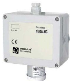
DURTEX HC DURTEX HC PRO

Vida útil en condiciones normales de trabajo: 4 años